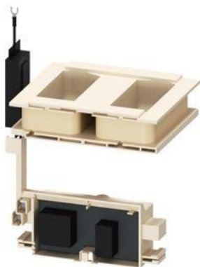
Катушка электромагнита для контактора 3TF6944-.C..., 200–240 В AC, 50/60 Гц